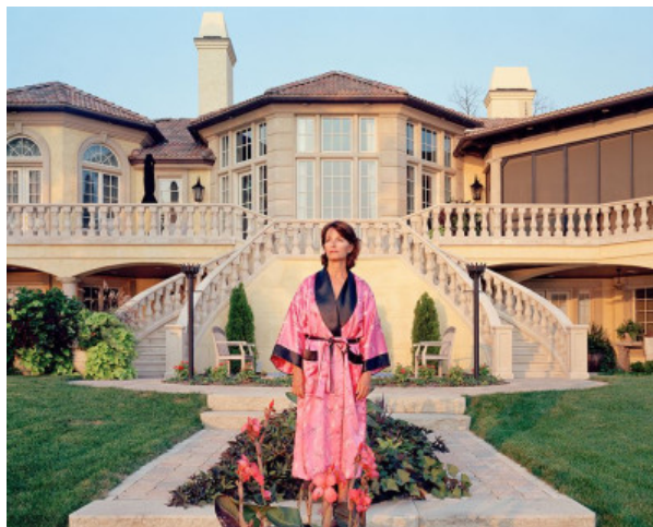
Angela Strassheim: Ohne Titel (Elsa), aus der Serie Zurückgelassen, 2005